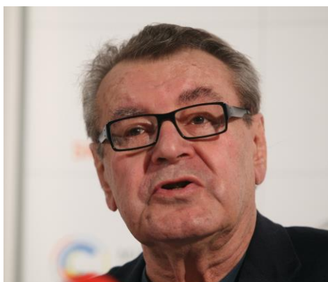
Obrázek 1 Miloš Forman

Základní škola má více než 130 let dlouhou tradici. Dnes je nejvíce spojována s výukou informatiky, na kterou se specializuje více než 20 let.