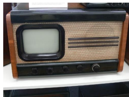
Obrázek 2 První televizor Tesla

Č eskoslovenská televize byla státní organizace zajišťující televizní vysílání v Československu od roku 1953, za pravidelné bylo toto vysílání prohlášeno 25. února 1954. I jako ostatní média byla podrobována silné cenzuře. V šedesátých letech byla součástí procesu společenského