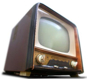
Obrázek 1 Televizní přijímač

Současné televize umožňují hybridní způsob vysílání a přístup na internet. Televizi lze ovládat pomocí klávesnice a myši zapojené v USB. Televize umožňují komunikaci s PC, prohlížení foto-